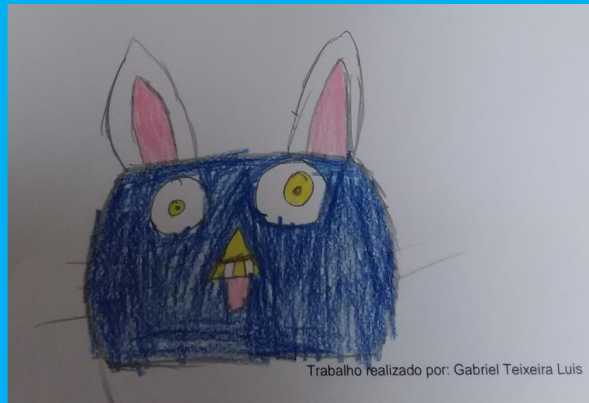
Trabalho realizado por: Gabriel Teixeira Luis